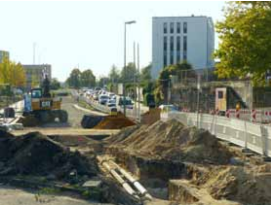
Durch Abbruch der Bahnbrücke potentielle Überführung des Radwegs Zangenstraße wegen Verbreiterung des Berthold-Beitz Boulevards zunichte gemacht

den vierspurigen Ausbau besagter Autostraße abgerissen worden ist, bleibt unerwähnt. Ohnehin scheint man daraus nichts gelernt zu haben, denn Ende des vergangenen Jahres wurde die ebenso für diese Radverbindung wichtige Brücke über den Berthold-Beitz-Boulevard (ex Bamlerstraße) abgebrochen – und auch hier war der völlig überflüssige vierspurige Ausbau dieser Autostraße der Grund. Besagte Brücke wird also ebenfalls irgendwann für teures Geld neu gebaut werden müssen. Das gilt auch für die nur wenige Meter entfernte ehemalige Überführung der früheren Krupp-Werksbahn über die Bottroper Straße, die im Jahr 2019 nur deshalb abgerissen wurde, damit die Autofahrbahn hier sechsspurig (!) ausgebaut werden kann. Eigentlich soll(te) exakt hierüber die derzeit in Planung befindliche Trasse des Radschnellwegs Mittleres Ruhrgebiet verlaufen. Somit wird man wohl auch hier demnächst sehr viel Geld in die Hand nehmen müssen. In der Presse findet dies bezeichnenderweise keine Erwähnung.