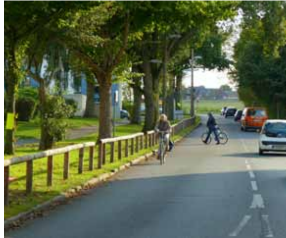
Humboldtstraße: Künstlich heraufbeschworener Konflikt um potentielle Baumfällungen wegen Radwegeplanung

Die Stadt Oberhausen übernimmt damit eine Vorreiterrolle in der Metropole Ruhr. Bei allen Fahrradtrassen mit Straßenquerung sind bisher Radfahrende wartepflichtig (z.B. Grüner Pfad in Duisburg, Allee des Wandels in Herten, Zollvereinstrasse in Essen). Lediglich die Stadt Dorsten räumt dem Radverkehr auf ihrer Fahrradtrasse nach Schermbeck Vorrang ein. Die Vorfahrtsberechtigung ist aber mitunter problematisch, da die oben genannten Sicherheitsaspekte nicht ausreichend vorhanden sind (freie Sichtbeziehung, Markierungen, Ausschilderung für Radfahrende oder Anrampung). Norbert Marißen