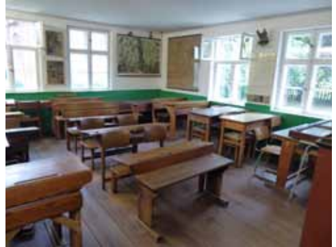
Warten auf Fräulein Lehrerin

es an der Küste immer flach ist, aber das Rauf und Runter lässt sich mit einem Pedelec prima radeln. Die längere Tour (20 km) beginnt in Middelhagen. Das kleine Fischerdorf hat seinen ländlichen Charme behalten und bietet einige Sehenswürdigkeiten. Hier steht die älteste Schule Rügens, heute ein Museum, und wer will, kann eine Unterrichtsstunde aus dem 19. Jahrhundert bei Fräulein Leh-