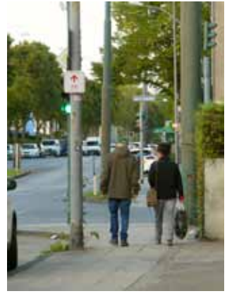
Als „Kompensation“ erfolgte Freigabe des viel zu schmalen Gehwegs des Weidkamps für den Radverkehr